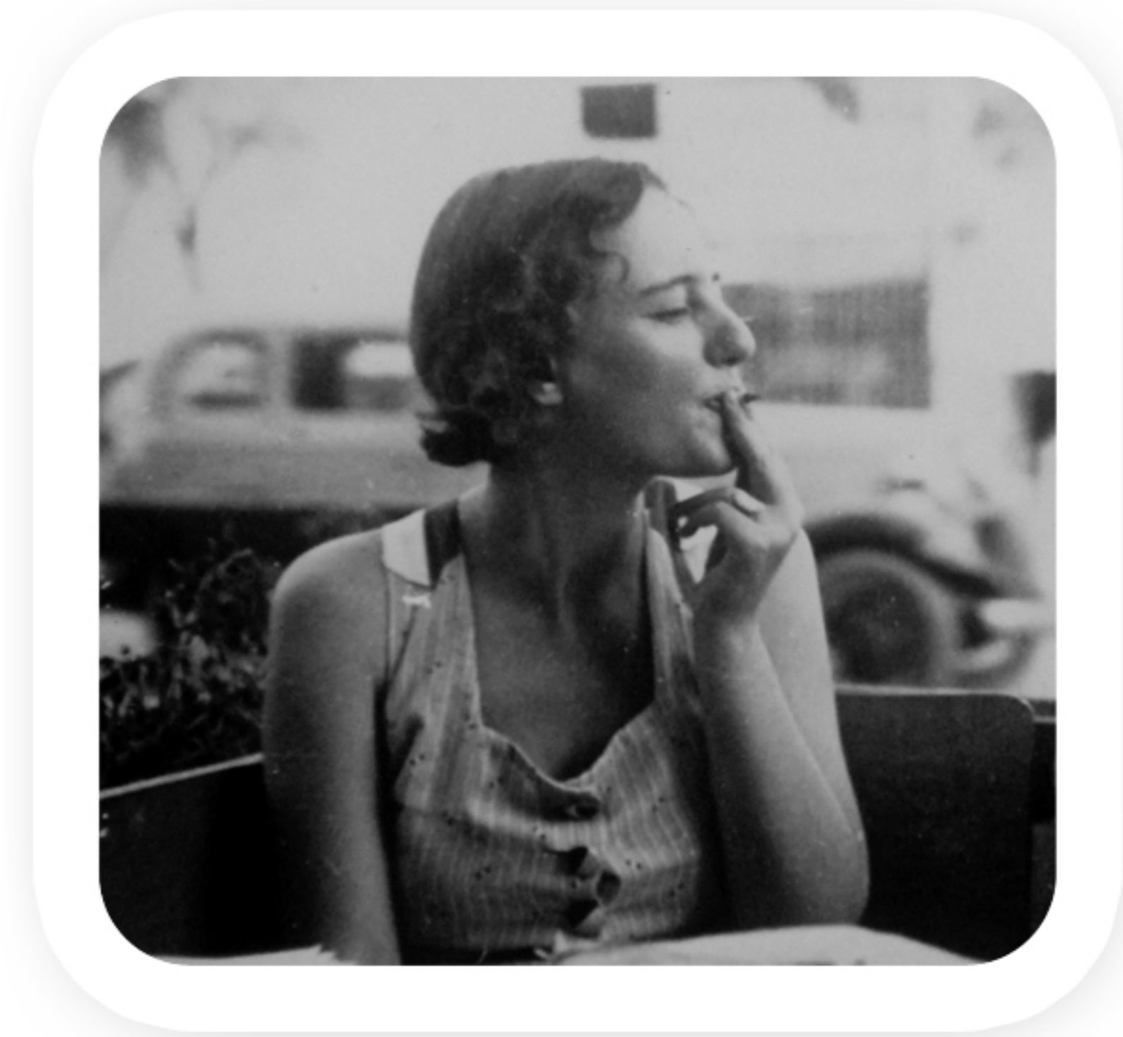
ספר שני: תקופת תל אביב (1935-1955)

רחוב ארנון איננו הרחוב הגדול ביותר בתל-אביב. אדרבה, רחוב קטן הוא, כמעט סמטה. התנועה בו מעטה, אוטו-קומתים אינו עובר בו, ולא כל אבטובוס אחר. רק מכוניות קטנות נוסעות בו, ופעם בפעם אוטו-משא. ולפי שאין התנועה רבה ברחוב זה, רבים בו הילדים. פי אבא ואמא אינם מפחדים, שמא ידרסו ילדיהם, ומתן להם לשחק בחוץ.